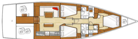
3 Kajüten - 3 Badezimmern