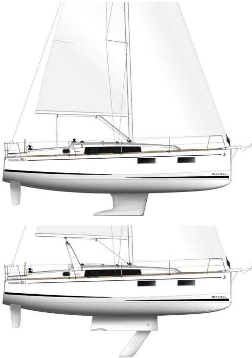
Schwertboot mit Großschotbügel (Option)