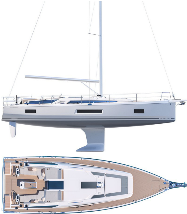
Version 3 Kabinen 2 Toiletten: