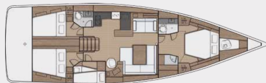
LOWER DECK 4 cabins, 2 bathrooms version - Version 4 cabines, 2 salles d'eau