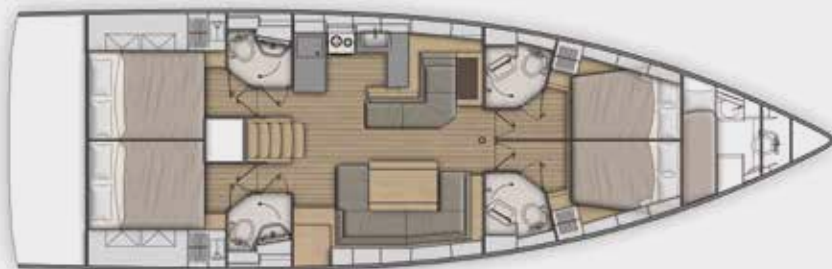
LOWER DECK 4 cabins, 4 bathrooms version - Version 4 cabines, 4 salles d'eau