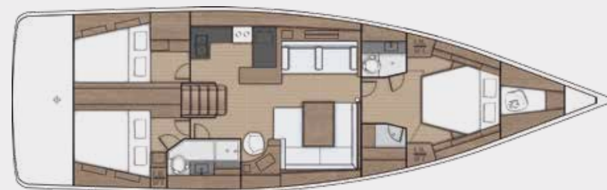
LOWER DECK 3 cabins, 2 bathrooms version - Version 3 cabines, 2 salles d'eau