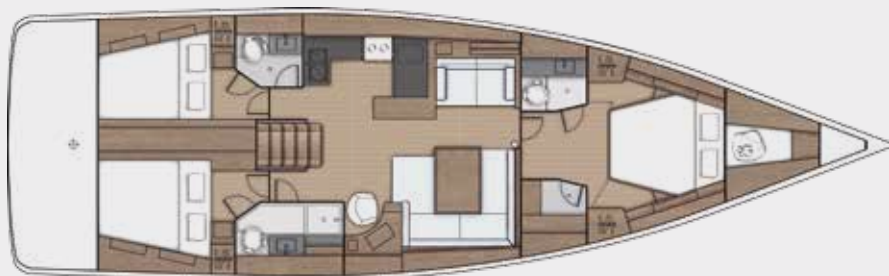
LOWER DECK 3 cabins, 3 bathrooms version - Version 3 cabines, 3 salles d'eau