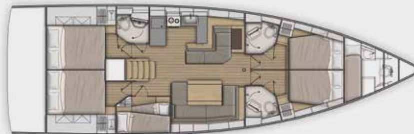
LOWER DECK 5 cabins, 3 bathrooms version - Version 5 cabines, 3 salles d'eau