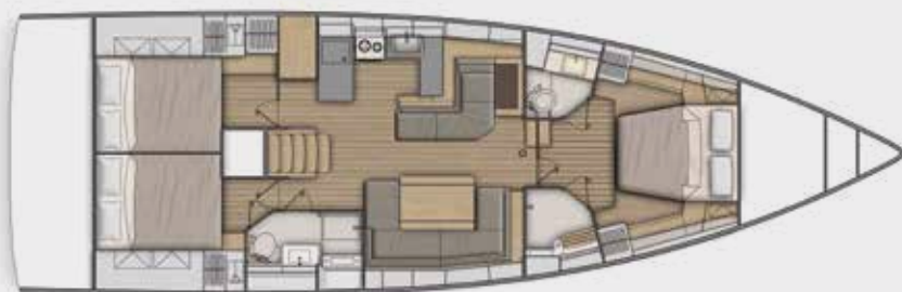
LOWER DECK 3 cabins, 2 bathrooms version - Version 3 cabines, 2 salles d'eau