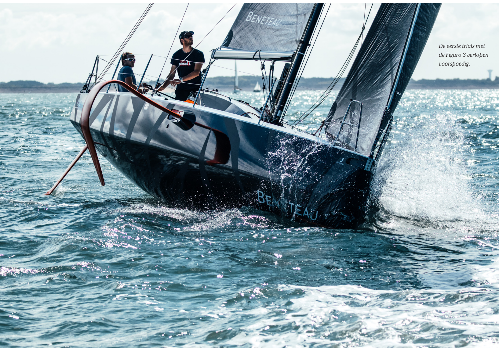
De eerste trials met de Figaro 3 verlopen voorspoedig.

De foils zijn bedoeld om oprichtend vermogen te genereren, ze vervangen 300 liter waterballast